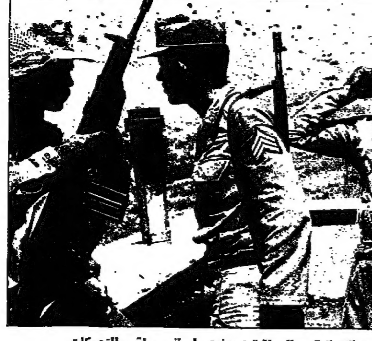
على الحدود الإيرانية - العراقية : جندي إيراني يراقب التحركات

الحدود الإيرانية - العراقية - جندي إيراني يراقب التحركات انها محل اذاعة حديد الحدود لعام ١٩٤٦ التي تحتفظ بها اذاعة الجزائر ، هي تحت تصرف لجنة خبراء من الدولتين لمراقبة الحدود بين البلدين ونزولها ونزولها ونزولها